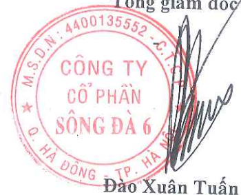
Đào Xuân Tuấn