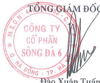
Đào Xuân Tuấn