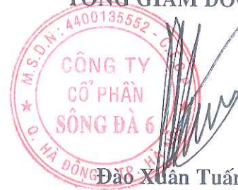
Đào Xuân Tuấn